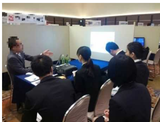
<合同企業説明会の様子>