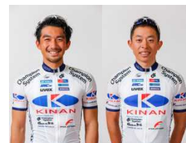
キナンサイクリングチーム