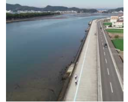
日本遺産和歌の浦