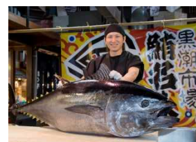
マグロ解体ショー

地元和歌山のよさこい演舞や獅子舞をはじめ、屋台村や自転車メーカーの展示試乗会などの充実した内容です。さらに17時からの開会セレモニー終了後には、マグロ解体ショーや和歌山の「うまいもん」グルメのふるまいを行います。