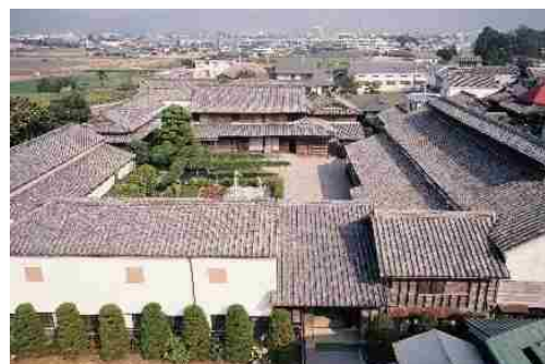
【「城構え」といわれる藍屋敷(奥村家住宅)】