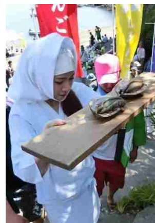
【海女の祭（しろんご祭）】