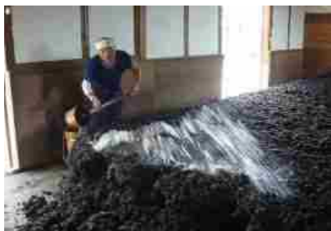
【阿波藍製造(寝せ込み)】

古くから日本人の生活に深くかかわり, 神秘的なブルーといわれた「藍」。徳島県の北部を雄大に流れる吉野川の流域は, 藍染料の日本一の産地です。この地域の平野部に見られる高い石垣と白壁の建物に囲まれた豪農屋敷や脇町の豪華な「うだつ」があがる町並み, 「阿波おどり」のリズムからは藍染料の流通を担い, 全国を雄飛した藍商人のかつての栄華をうかがい知ることができます。この地域では, 今も藍染料が伝統的な技法で生み出されており, その色彩は人々を魅了し続けています。