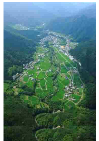
【日根荘大木の農村景観】

今から800年前、泉佐野市は上級貴族、九条家の領地「日根荘」でした。ここには二枚の荘園絵図と九条政基が書いた「旅引付」という日記が残されています。絵図には緑豊かな風景に、田畑に恵の水を注ぐため池や水路、社寺などが描かれ、日記には500年前の村の生活や人々の様子がいきいきと記されています。荘園の地を創り、中世から受け継がれてきた現在のこの風景は、絵図や日記に描かれた魅力ある農村景観へと誘ってくれるのです。