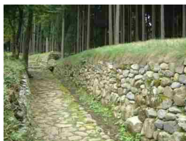
【白山平泉寺旧境内】