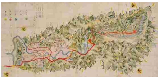
【犬鳴山七宝瀧寺並びに大木村絵図】