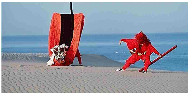
【鳥取砂丘の風紋と麒麟獅子】

人々は，厳しい風の季節での無事とそれを乗り越えた感謝を胸に，古来より幸せを呼ぶ麒麟獅子を舞い続け，麒麟に出会う旅人にも幸せを分け与えている。