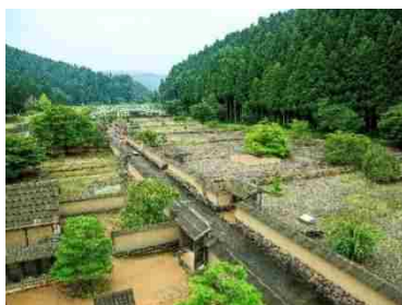
【一乗谷朝倉氏遺跡】