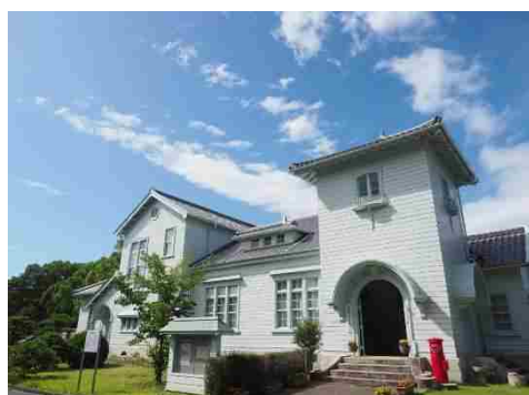
【旧日本専売公社赤穂支局（赤穂塩務局）事務所】

江戸時代、システムティックな入浜塩田による塩づくりが確立された播州赤穂。瀬戸内の穏やかな海と気候に抱かれ、千種川が中国山地からもたらした良質の砂からできた広大な干潟は、入浜塩田の開発に適していた。その製塩技術は、瀬戸内海沿岸に広がり、市場を席卷するまでに成長した。中でも赤穂の塩は、国内きってのブランドとして名を馳せ、赤穂に多彩な恵みをもたらした。このまちには瀬戸内海から生み出される塩とともに歩んできた歴史文化が蓄積され、現在に息づいている。赤穂は今なお「塩の国」なのである。