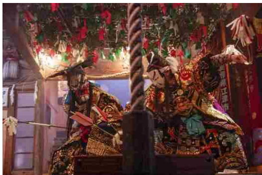
【神社での奉納神楽】

島根県西部，石見地域一円に根付く神楽は，地域の伝統芸能でありながらも，時代の変化を受容し発展を続けてきた。その厳かさと華やかさは，人の心を惹きつけて離さない。神へささげる神楽を大切にしながら，現在は地域のイベントなどでも年間を通じて盛んに舞われ，週末になればどこからか神楽囃子が聞こえてくる。老若男女，観る者を魅了する石見地域の神楽。それは古来より地域とともに歩み発展してきた，石見人が世界に誇る宝なのだ。