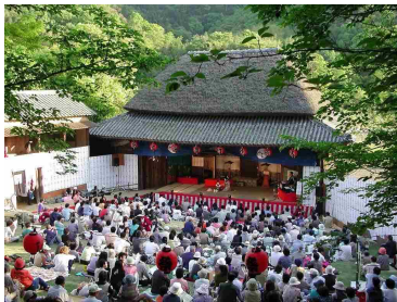
【小豆島農村歌舞伎及び舞台, 石の栈敷席】

瀬戸内備讃諸島の花崗岩と石切り技術は長きにわたり日本の建築文化を支えてきた。日本の近代化を象徴する日本銀行本店本館などの西洋建築, また古くは近世城郭の代表である大坂城の石垣など, 日本のランドマークとなる建造物が, ここから切り出された石で築かれている。島々には, 400年に渡って巨石を切り, 加工し, 海を通じて運び, 石と共に生きてきた人たちの希有な産業文化が息づいている。世紀を越えて石を切り出した丁場 ちようば は独特の壮観な景観を形成し, 船を操り巨石を運んだ民は, 富と迷路の様な集落を遺した。今なお, 石にまつわる信仰や生活文化, 芸能が継承されている。