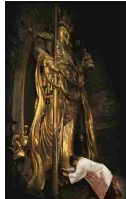
【木造十一面観音立像（長谷寺）】