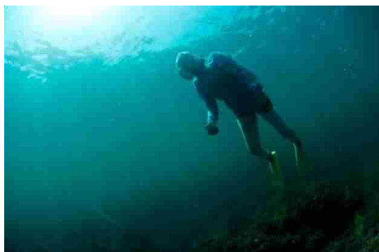
【鳥羽・志摩の海女漁の技術】

豊かな海産物に恵まれた鳥羽・志摩は、全国の約半数の海女が活躍する日本一の「海女に出逢えるまち」である。この地域で、女性が素潜りでアワビ、サザエや海藻を獲る海女漁の始まりは約 2,000 年前まで遡り、世界でも日本と韓国のみ希少な漁法である。海女が獲った海産物は伊勢神宮に「 しんま 神饌（神様に捧げる供物）」として奉納され続けており、海女が中心となる祭も継承されているなど、海女ならではの風習や信仰などの「海女文化」が今も色濃く息づいている。鳥羽・志摩をめぐれば、海女文化を「五感」で体感でき、元気な海女からパワーをもらえるに違いない。