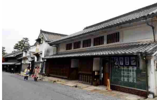
【服部幸平家住宅倉・服部良也家住宅】