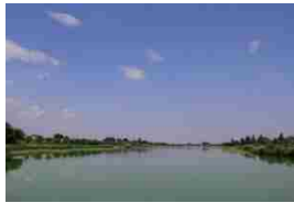
【左上：茂林寺沼及び低地湿原 右上：多々良沼，左下：城沼】