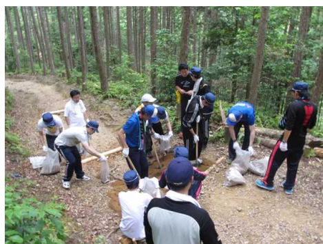
※これまでの道普請活動の様子