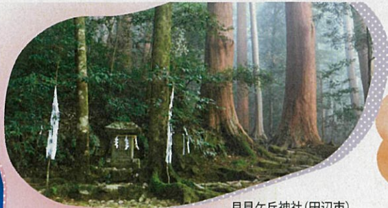
月見ヶ丘神社(田辺市)