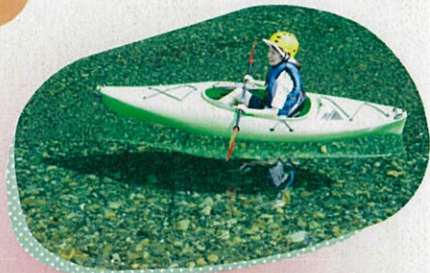
清流古座川・カヌー(古座川町)