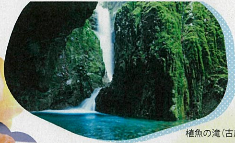
植魚の滝(古座川町)