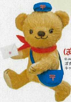
ぽすくま © JAPAN POST Co., Ltd. ぽすくまは日本郵便の キャラクターです。