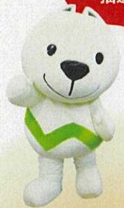
和歌山県PRキャラクター きいちちゃん