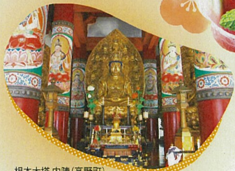
根本大塔 内陣(高野町)