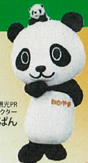
和歌山観光PR シンボルキャラクター わかばん

5月27日(月)~5月31日(金) 17:30~23:00 KITTE 地下1階 東京シアアイカフェにて 1日30個限定 紀州産南高梅(しらら)を お試しください!