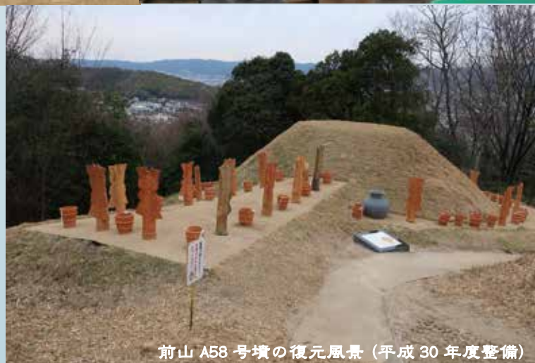
前山A58号墳の復元風景(平成30年度整備)