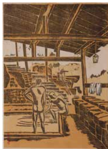
7.前川千帆 温泉 1933（昭和 8）年 石版、紙 当館蔵