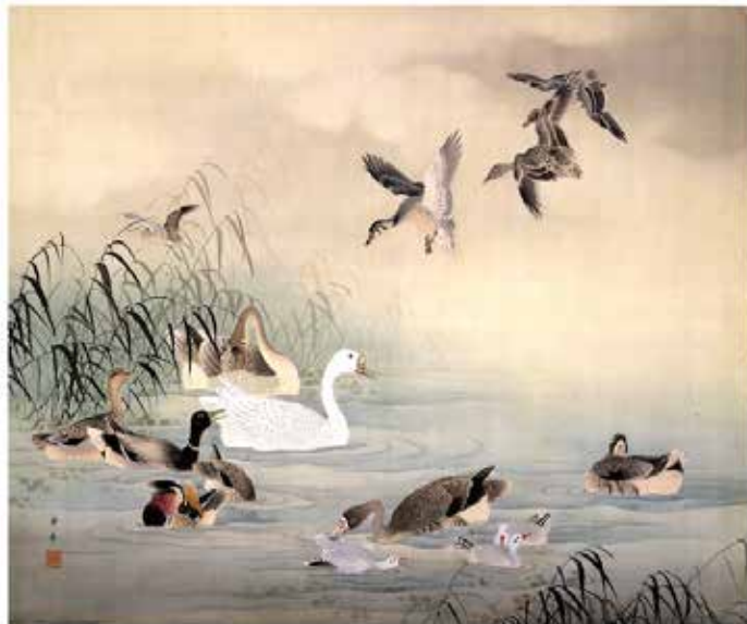
1. 今尾景年 芦水禽図 明治年間 顔料、絹 滋賀県立近代美術館