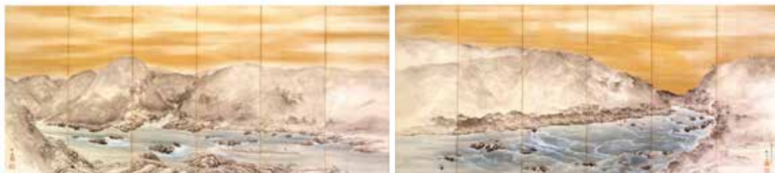
4.岸竹堂 保津峡図 1892(明治25) 顔料、紙 滋賀県立近代美術館

今回は、伝統と革新の相克の中で繰り広げられた幕末から明治末頃までの京都の日本画を、約20点の作品と関連資料によりご紹介します。