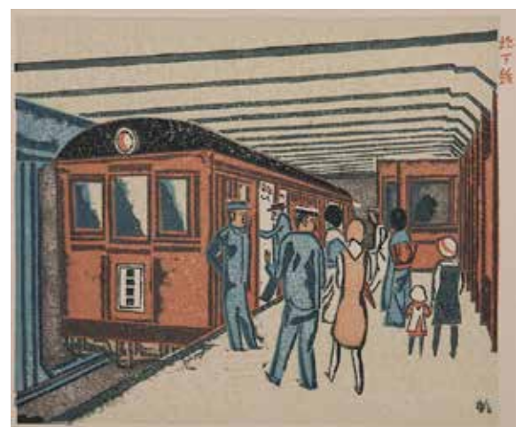
8.前川千帆『新東京百景』第3輯第22号「地下鉄」 1931（昭和 6）年 木版、紙 当館蔵