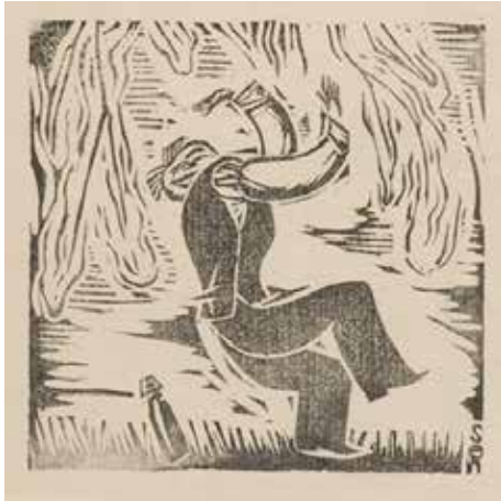
9.前川千帆 『風』再刊第2号「野外小品(酒)」 1929(昭和4)年 リノカット、紙 当館蔵