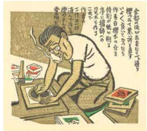
5.『閑中閑本 第廿七冊 閑本工程帖』1960（昭和 35）年より 版画を摺る前川千帆 木版、紙 個人蔵

千帆については、1977（昭和 52）年に「前川千帆名作展」（リッカー美術館）がなされたものの、その後大きく取り上げられることはありませんでした。本展覧会で改めて紹介する約 70 点の作品と関連資料によって、版画家・前川千帆の「和らか」な魅力をぜひご覧いただきたいと思います。