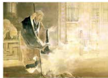
3.山元春挙 法塵一掃 1901(明治34)年 顔料、絹 滋賀県立近代美術館

現在、滋賀県立近代美術館が大規模な増築・改修をおこなうにあたり、その休館中に同館のコレクションの一部を当館で公開しています。この特集展示では、同館の日本画コレクションから、明治期を中心に活躍した京都の日本画家たちの作品を紹介します。