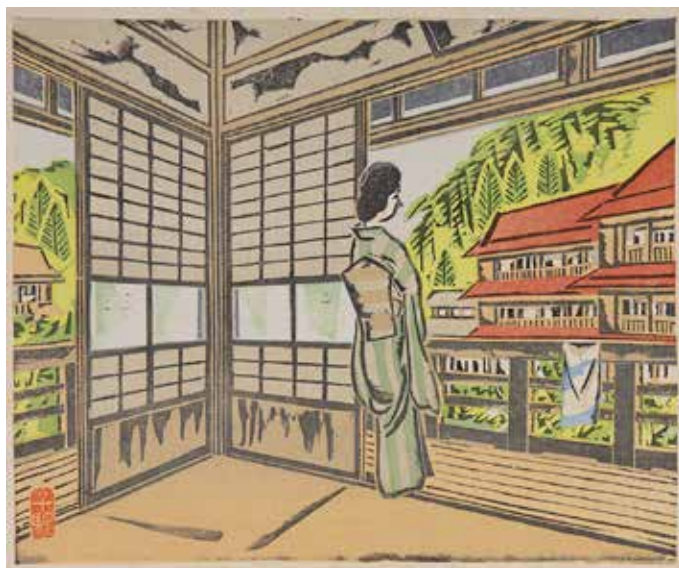
2. 前川千帆 温泉宿 1940(昭和15)年頃 木版、紙 当館蔵