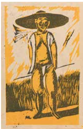
6.前川千帆『風』再刊第1号「百姓」 1929（昭和 4）年 木版、紙 当館蔵