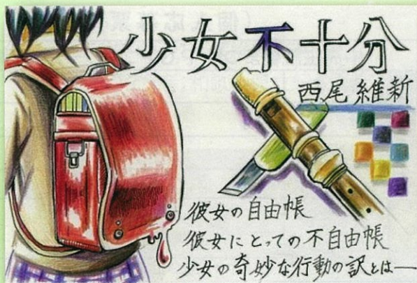
(優秀賞・中学生の部)