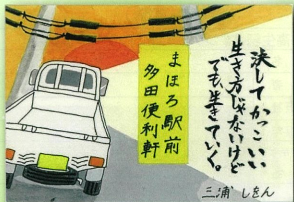
(優秀賞・高校生の部)