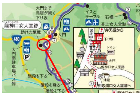
道普請実施予定箇所

※平成21年度から企業・学校等135団体、累計3万1千人以上の方に参加いただいております。