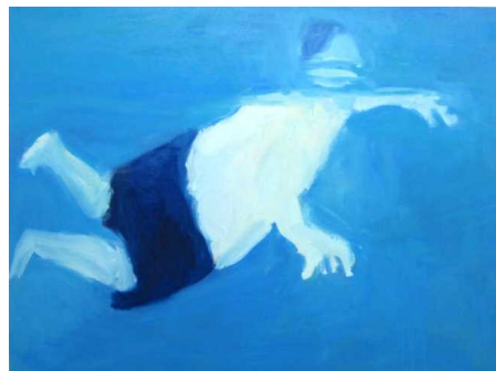
坂井淑恵《Whale》2017(平成29)/油彩、キャンバス/112.0×145.5/個人蔵