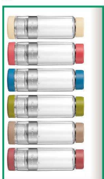
※お開きのタンナーは選択できません