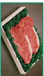
※内容は主催者のものと異なります