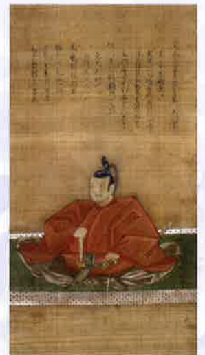
●水野重仲像 全正寺蔵 紀伊藩付家老水野重仲の肖像画