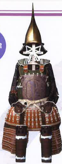
●薄浅葱米 威五枚胴具足(安藤直清所用) 和歌山県立博物館蔵 南蛮好みであった直清の嗜好を示す

徳川頼宣(1602~71)が和歌山に入国して400年の節目に行うこの展覧会では、和歌山県立博物館と和歌山市立博物館との共同調査の成果もふまえ、父・徳川家康から譲り受けた駿河御分物をはじめ、頼宣や頼宣ゆかりの人物(母・養珠院、正室・瑤林院など)の所用品、紀伊徳川家ゆかりの寺社に残されている宝物、頼宣に仕えた家臣の家に伝来した資料などを紹介します。