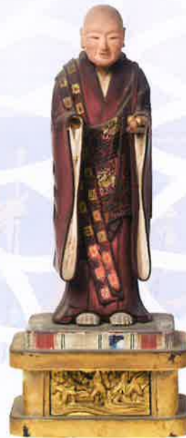
●七面山踏分之霊像(養珠院像) 本遠寺蔵 養珠院は女性で初めて七面山に登った