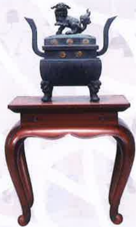
●銅製香炉 並 朱漆塗香台 長保寺蔵 將軍徳川吉宗が長保寺にある頼宣の霊前に寄進したもの