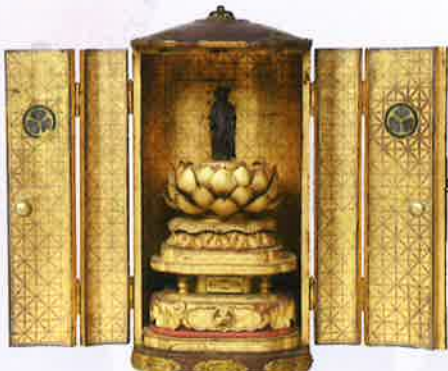
●焼津市指定文化財(附) 徳川頼宣守り本尊 並 内厨子 海蔵寺蔵 駿河時代の頼宣が守り本尊とした地藏菩薩と厨子