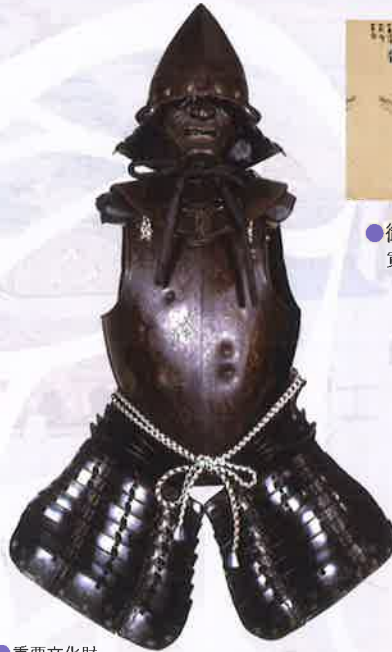
●重要文化財 南蛮胴具足(徳川家康所用) 紀州東照宮蔵 頼宣が家康の遺品として譲り受けた駿河御分物の1つ

徳川頼宣(1602~71)が和歌山に入国して400年の節目に行うこの展覧会では、和歌山県立博物館と和歌山市立博物館との共同調査の成果もふまえ、父・徳川家康から譲り受けた駿河御分物をはじめ、頼宣や頼宣ゆかりの人物(母・養珠院、正室・瑤林院など)の所用品、紀伊徳川家ゆかりの寺社に残されている宝物、頼宣に仕えた家臣の家に伝来した資料などを紹介します。