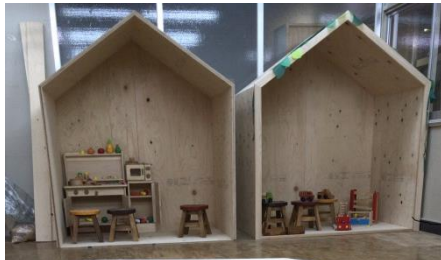
木製の小屋とままごとセット