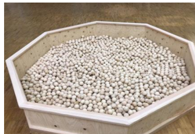
ヒノキボールプール