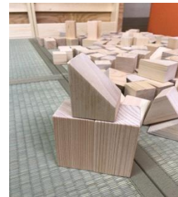
いろんな積木で遊べる