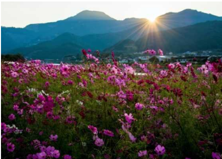
「朝日を浴びて」 山本 正治 様(田辺市) 撮影場所 上富田町