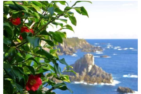
「冬椿咲く」 久保 俊哉 様(富田林市) 撮影場所 串本町