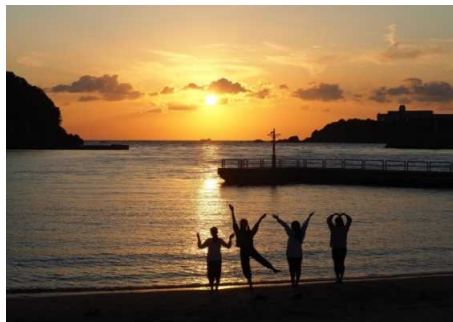
「夕日と少女」 川上 剛史 様(すさみ町) 撮影場所 すさみ町