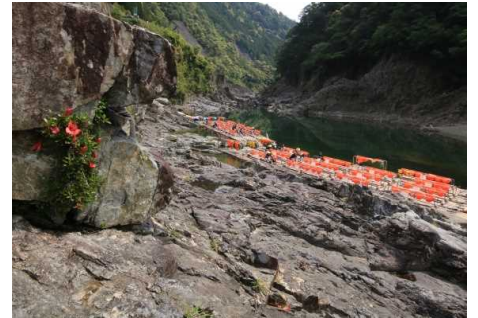
「初就航の日」 田上 盛一 様(上富田町) 撮影場所 北山村