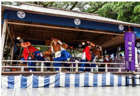
「那智の田楽」 上地 浩史 様(三重県紀宝町) 撮影場所 那智勝浦町