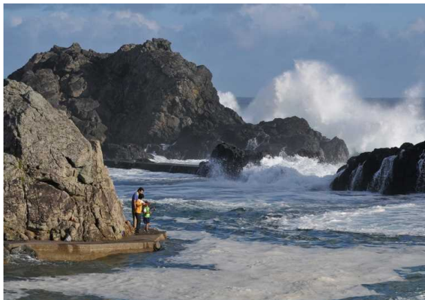
「台風襲来」 石川 昭春様(串本町) 撮影場所 串本町