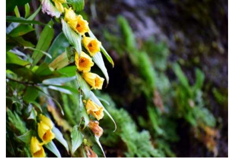
「山里の貴婦人(キジヨウウツトギス)」