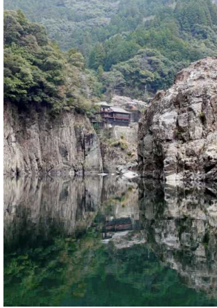
「ふたつの世界」 宮地 恵 様(三重県御浜町) 撮影場所 瀨峡