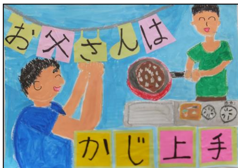
小学生低学年の部