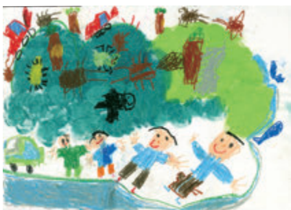
「山へ虫とりに行くよ」