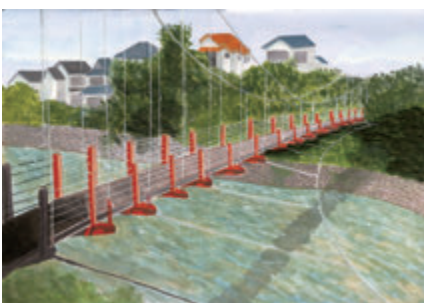
「貴志川大國主神社より」