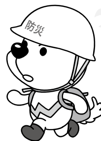
和歌山県PRキャラクター 「まいちゃん」