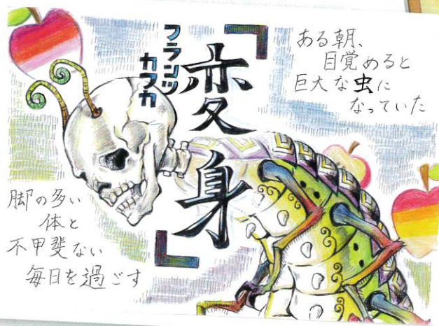
(最優秀賞・高校生の部)