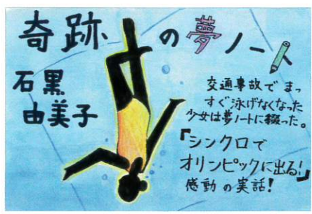
(優秀賞・中学生の部)