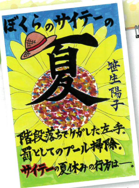
(最優秀賞・中学生の部)