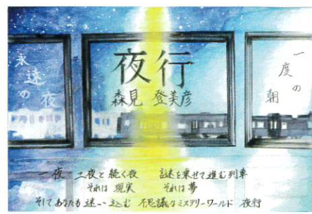
(優秀賞・高校生の部)