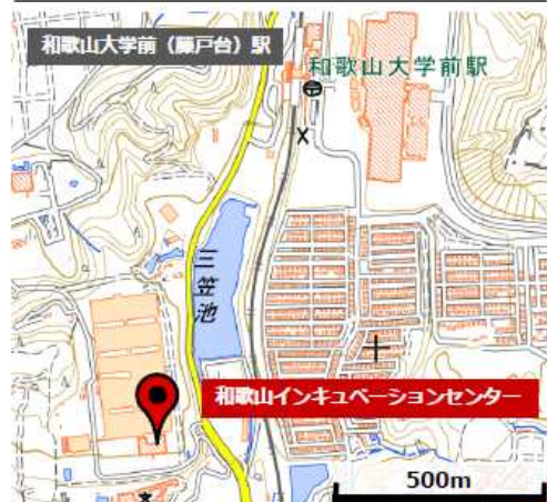
最寄り駅（和歌山大学前）からのアクセス