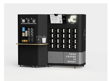
AI カフェロボット「root C」

事業所名：株式会社New Innovations 和歌山研究開発センター 進出場所：和歌山インキュベーションセンター （和歌山市梅原579-1 ノーリツプレジジョン株式会社オフィス棟4階） 業務内容：AIカフェロボット「root C」の開発等 操業時期：令和2年10月中旬（予定）