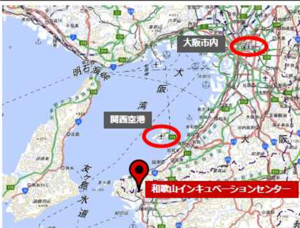
大阪市内、関西空港からのアクセス