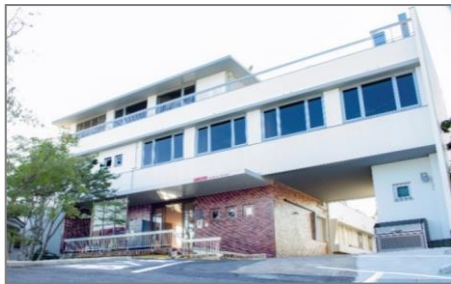
ITビジネスオフィス 「ANCHOR」(アンカー)