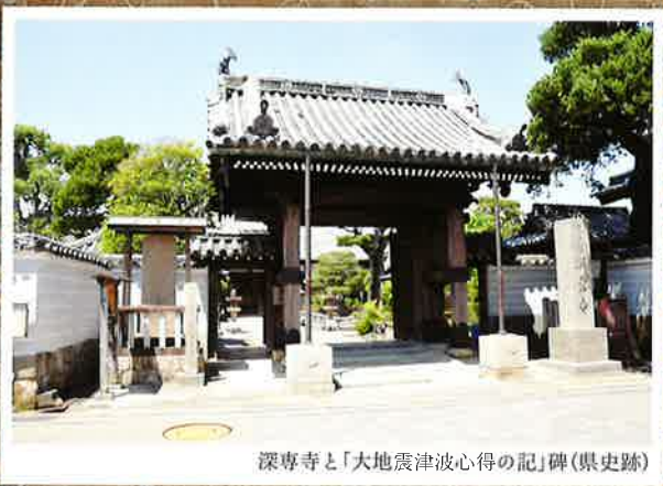
深専寺と「大地震津波心得の記」碑(県史跡)