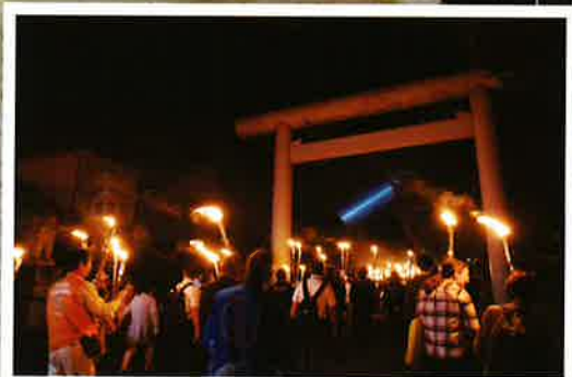
廣八幡宮への避難訓練