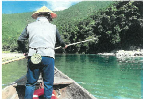
「安居の渡し」 日置中学校 様(白浜町) 撮影場所 白浜町