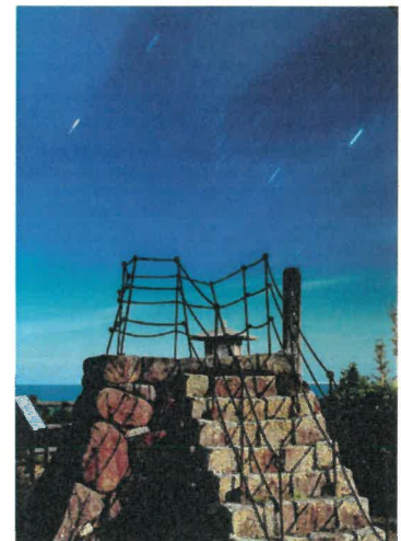
「燈明崎のオリオン」