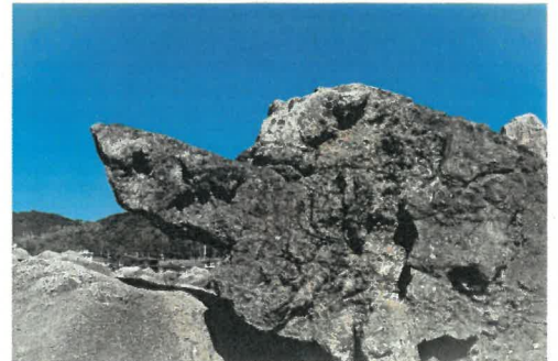
「対決(Jaws vs ゴジラ)」