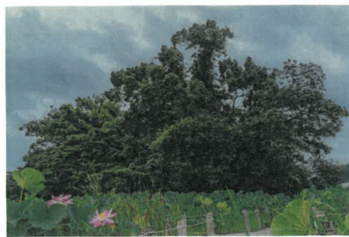
「神の森」 入澤 和彦 様(田辺市) 撮影場所 上富田町