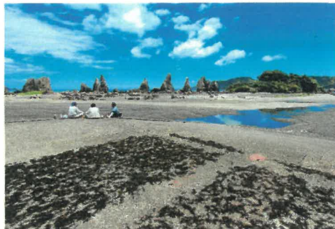
「橋杭岩春景」 鈴木 里司 様(串本町) 撮影場所 串本町