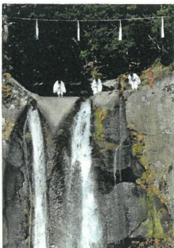
「心ひきしめてのしめ縄張り終えて」 中西 克仁 様(海南市) 撮影場所 那智勝浦町