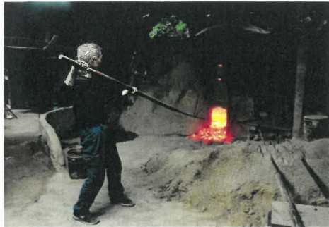
「紀州備長炭の窯出し」 鎌谷 悟 様(すさみ町) 撮影場所 すさみ町