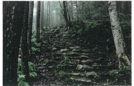
「いにしえへ」 木下 滋 様(白浜町) 撮影場所 新宮市