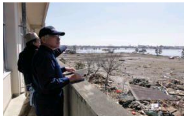
【井戸連合長による被災地視察(平成23年3月19日)】