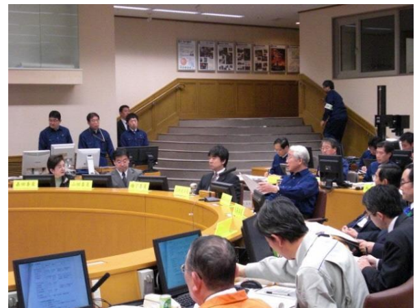
【緊急の広域連合委員会(平成23年3月13日)】