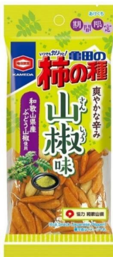
『50g 亀田の柿の種 山椒味』