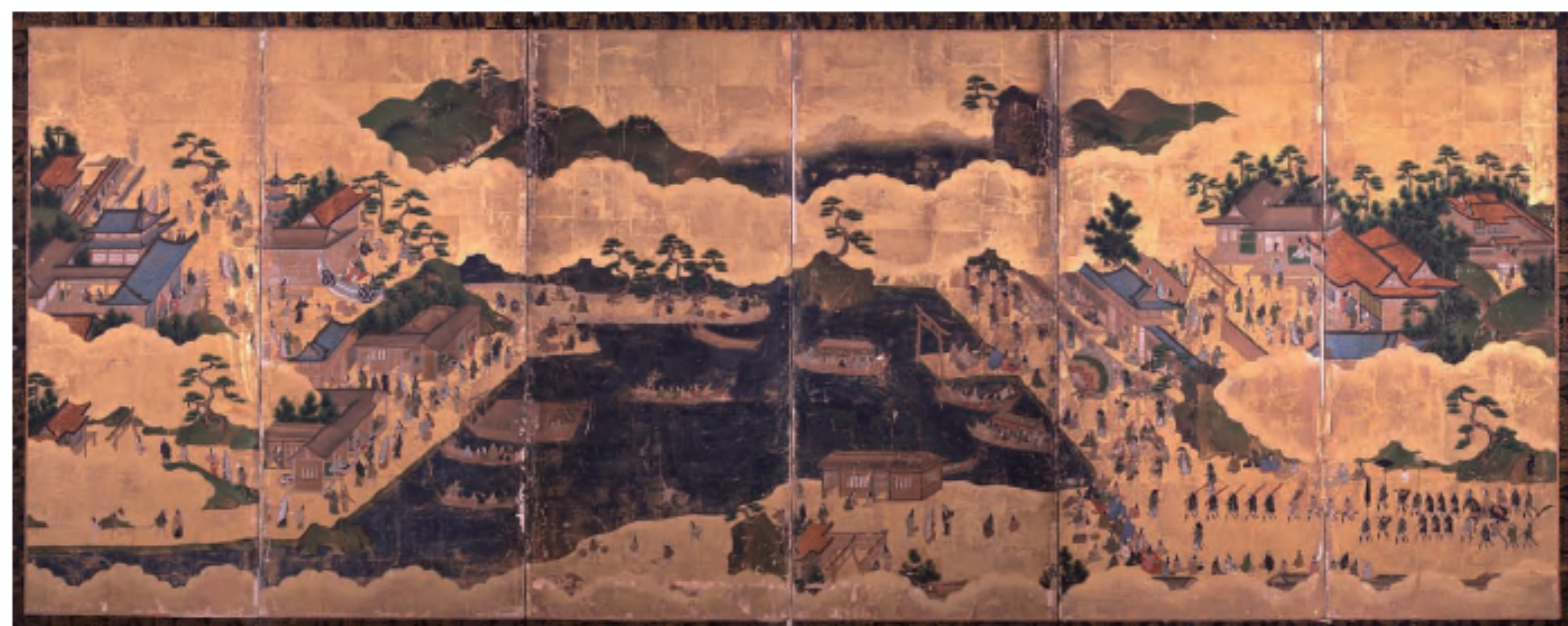
展示番号12 和歌浦図屏風 和歌山県立博物館蔵

この企画展では、寺社絵図を中心に、明治時代以前における寺社の風景を紹介いたします。展示では高野山を起点、新宮を終点として和歌山県内を反時計回りにぐるっとまわるようなかたちで様々な寺社の様相を紹介していきます。往時の景観と現在の景観とを重ねあわせながら、それぞれの寺社がたどった歴史に思いを馳せていただくとともに、和歌山の聖地・霊場をめぐっていただけたらと思います。