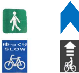
歩道への路面表示 車道への路面表示