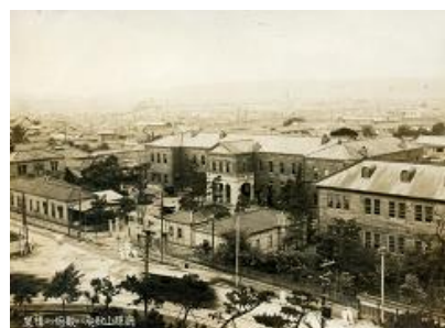
明治22年に新築された和歌山県庁

※記念式典に併せて物産販売を行います。（場所／県文前広場 時間／11:30～17:30）