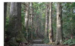
⑦紀伊山地の霊場と参詣道（平成18年）