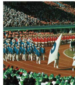
④黒潮国体の入場行進（昭和46年）