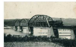
①南海鉄道が全線開通（明治36年）

※は数値が資料によって異なるが、「和歌山市庶務課事務報告書」による。