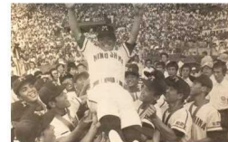
⑤県立箕島高等学校野球部が甲子園で春夏連覇達成（昭和54年）