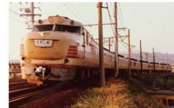
③特急「くろしお」号（昭和40年）