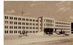
②落成当時の和歌山県庁舎（昭和13年）