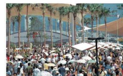
⑥「世界リゾート博」開催（平成6年）