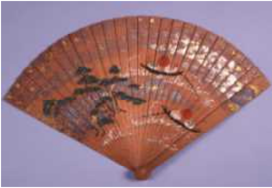
国宝 彩繪繪扇(熊野速玉大社古神宝類のうち)(熊野速玉大社蔵)