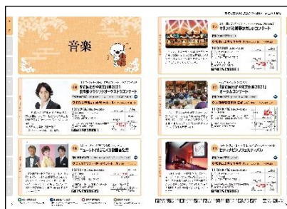
（市町村実行委員会及び文化関係団体主催事業等）