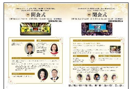
（県実行委員会主催事業）