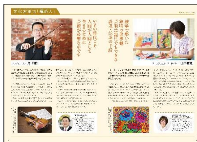
（特別インタビュー）