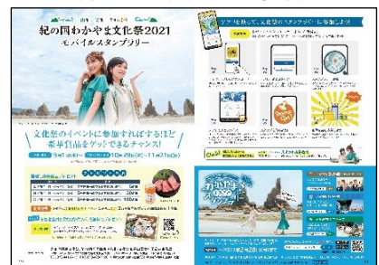
（モバイルスタンプラリー）