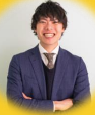
株式会社みらいワークス 東大斗