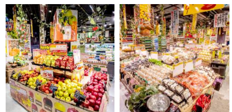
OPモール本店の様子