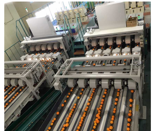
みかん選果の様子