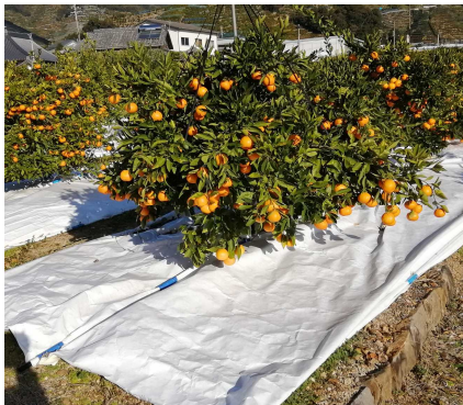
マルチシートの被覆を推進