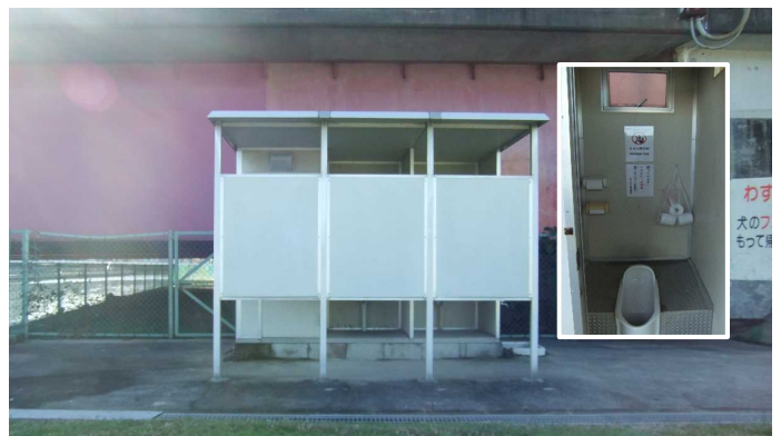
設置した快適トイレ