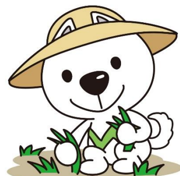
和歌山県PRキャラクター 「きいちゃん」