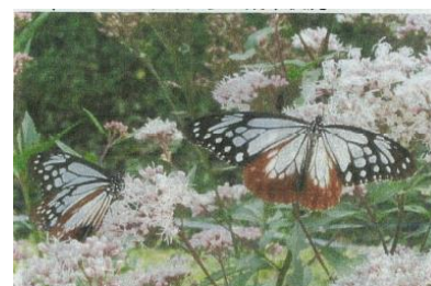
フジバカマにたくさん 飛来したアサギマダラ