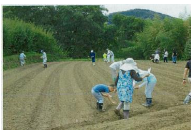
地域住民で 菜の花の種まき