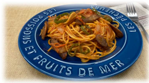
イタリアンジビエスパゲッティ