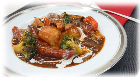
ジビエのブラウンシチュー