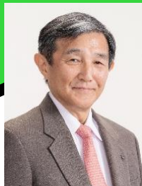
和歌山県知事 仁坂 吉伸

1974年東京大学経済学部卒業。同年4月に通商産業省に入省。大臣官房審議官（通商政策局担当）、製造産業局次長等を歴任。2003年7月ブルネイ国大使に就任。2006年12月に和歌山県知事に就任、2020年12月に関西広域連合長に就任、現在に至る。