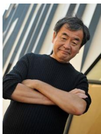
建築家 東京大学 特別教授・名誉教授 隈 研吾

1974年東京大学経済学部卒業。同年4月に通商産業省に入省。大臣官房審議官（通商政策局担当）、製造産業局次長等を歴任。2003年7月ブルネイ国大使に就任。2006年12月に和歌山県知事に就任、2020年12月に関西広域連合長に就任、現在に至る。