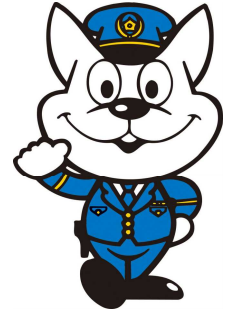
和歌山県警察 シンボルマスコット 《きしゅう君》

和歌山県警察本部 〒640-8588 和歌山市小松原通一丁目1番地1 TEL 073(423)0110(内線2626) FAX 073(423)0560 和歌山県人事委員会 〒640-8585 和歌山市小松原通一丁目1番地 TEL 073(441)3763(直通) FAX 073(433)4085