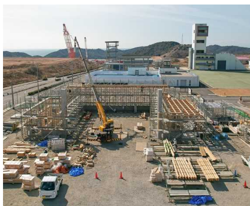
ドクターヘリ避難格納庫 【工事中】