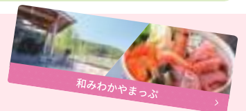
和みわかやまっぷ

グルメや温泉、お土産などに使えるお得なクーポン付き スタンプラリー。お店を巡ってスタンプを集めると、抽選で ペア宿泊券や和歌山の名産品が当たる。