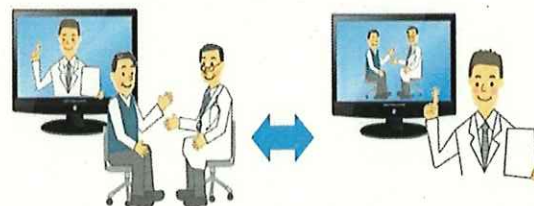
和歌山県立医科大学 附属病院