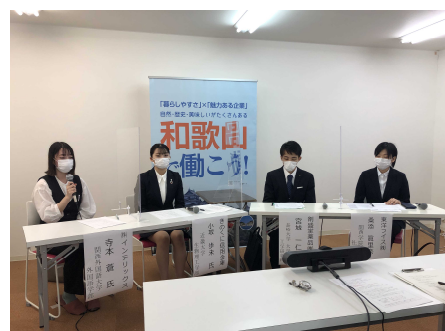
パネルディスカッションの様子（内容④）