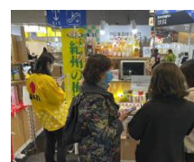
第四回中国国際輸入博覧会の様子