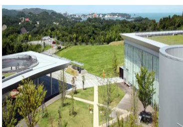
開放的な空間のあるオフィス環境