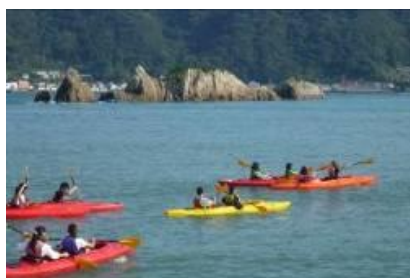
シーカヤック体験