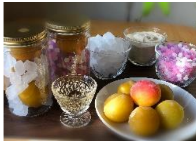
梅干・ジュース作り体験