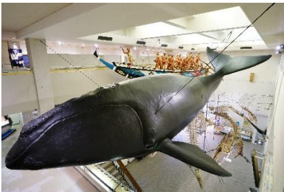
くじらの博物館学習プログラム