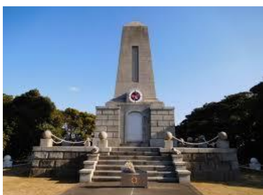
日本・トルコ友好の歴史ツアー