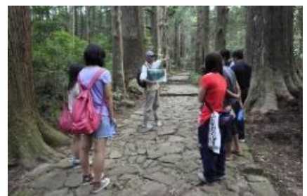
熊野古道ウォーク