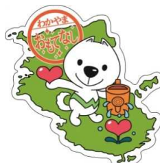
和歌山県PRキャラクター「きいちゃん」