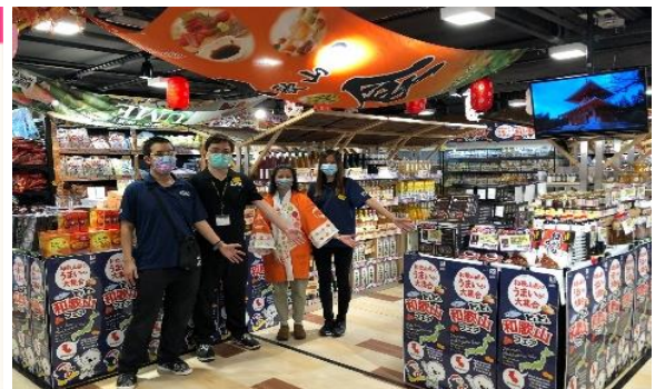
和歌山フェア in 香港 DON DON DONKI の様子 （期間：令和3年11月～令和4年2月末）