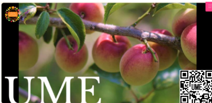
青梅PRサイト（繁体字）