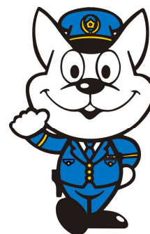
和歌山県警察 シンボルマスコット 《きしゅう君》

和歌山県警察本部 〒640-8588 和歌山市小松原通一丁目1番地1 TEL 073(423)0110(内線2626) FAX 073(423)0560 和歌山県人事委員会 〒640-8585 和歌山市小松原通一丁目1番地 TEL 073(441)3763(直通) FAX 073(433)4085