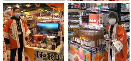
昨年香港で開催した和歌山フェアの様子