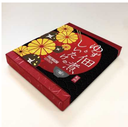
ゆずと椎茸の佃煮